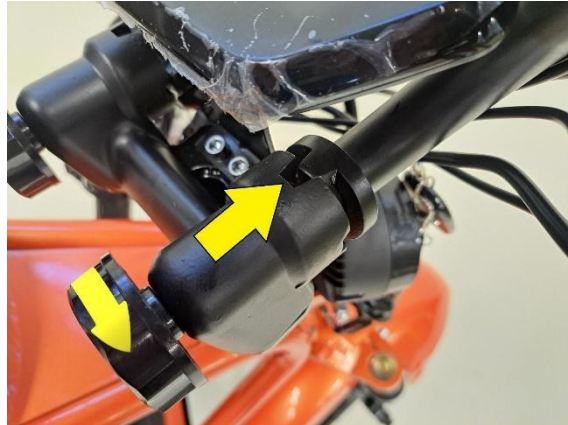
Katso, että ohjaustangon puolikkaat lukkiutuvat paikoilleen. Kiristä ohjaustangon puolikkaat kiristysrullasta.