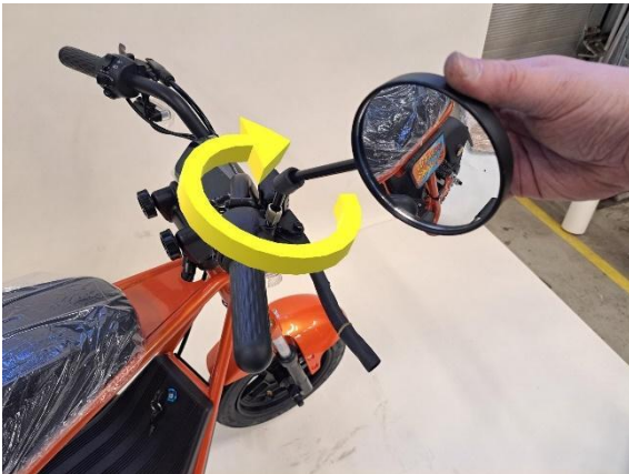
Pyörittele sivupeilit paikoilleen.