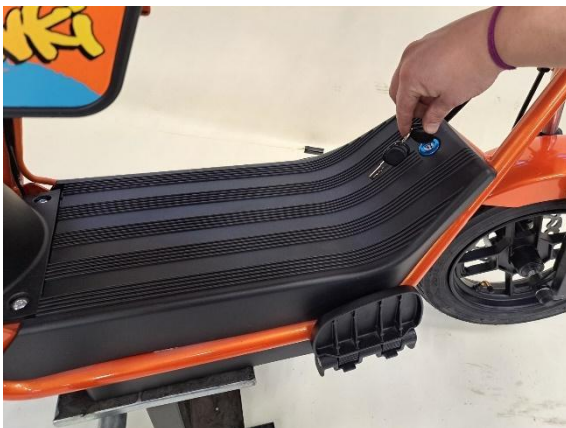
Avaa akkukotelon kansi avaimella.