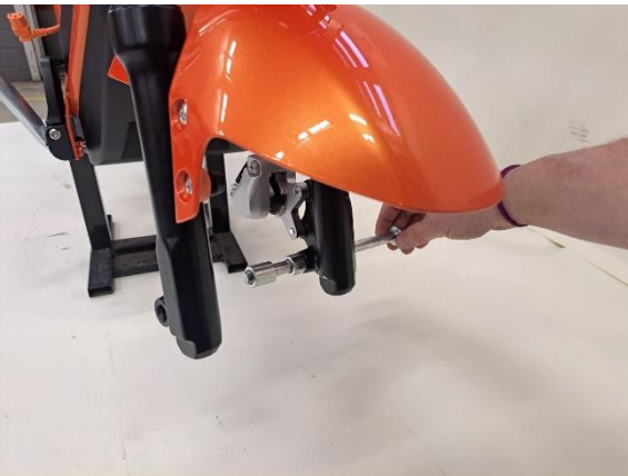
Ota etuakseli pois.