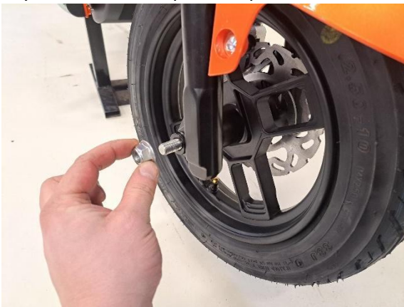
Työnnä etuakseli kokonaan läpi ja laita kiinnitysmutteri paikoilleen (kiintoavain 17mm).