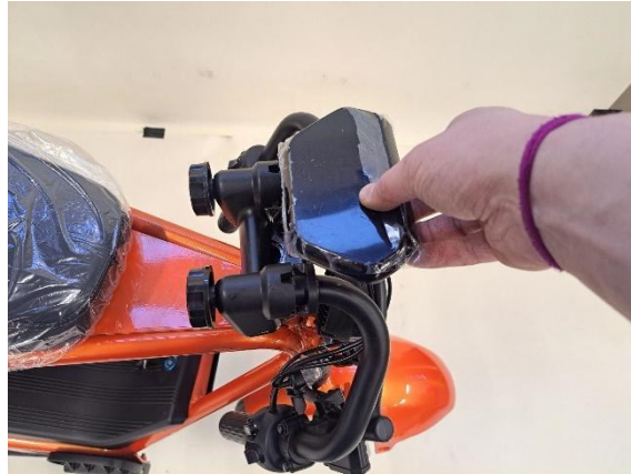
Laita mittaristo paikoilleen irroitetuilla kiinnityspulteilla (kuusiokoloavain 5mm).