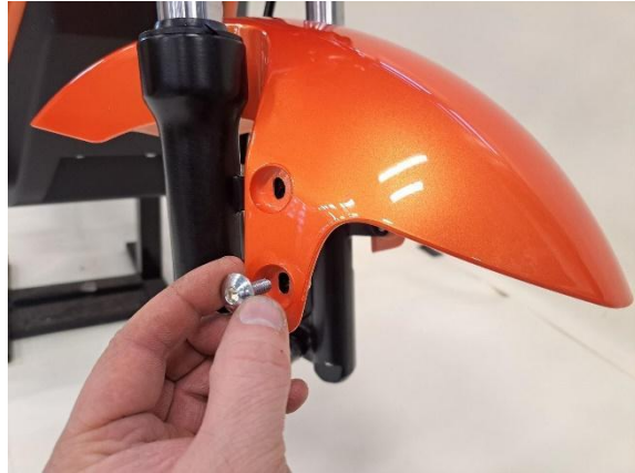
Kiinnitä etulokasuoja neljällä kupukantaisella kiinnityspultilla (kuusiokoloavain 5mm).