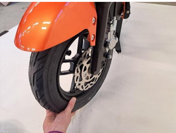
Nosta etupyörä paikoilleen.