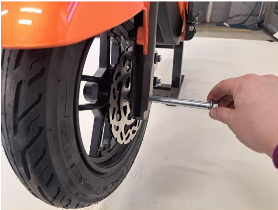
Työnnä etuakseli puoliksi paikoilleen.