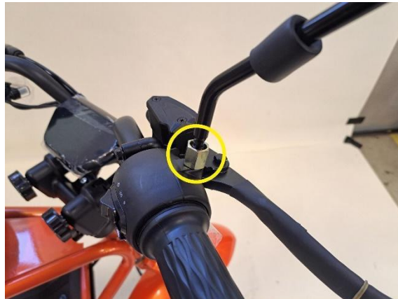
Oikean asennon löydyttyä kiristä mutterit (kiintoavain 14mm). Laita suojat muttereiden päälle.