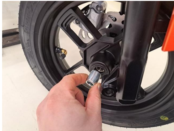
Laita pitempi holkki etupyörään paikoilleen.