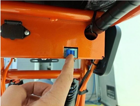
Käännä päävirtakytkin ON-asentoon.