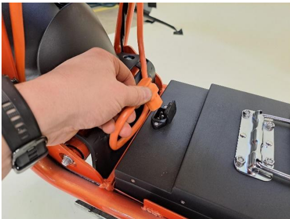
Laita pistoke kiinni akkuun.