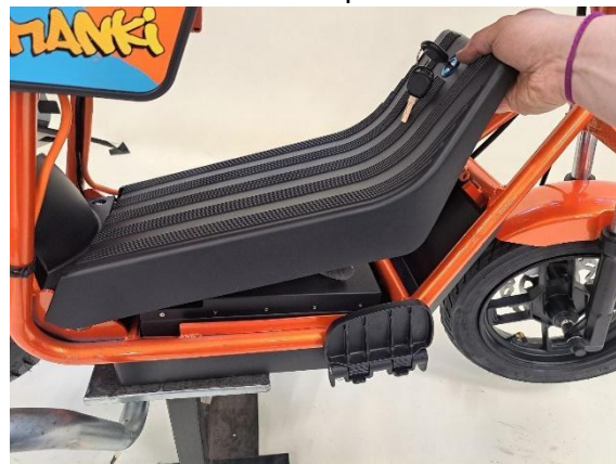
Laita akkukotelon kansi paikoilleen.