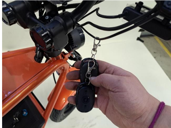
Ota esille kaukokäyttö avaimet.