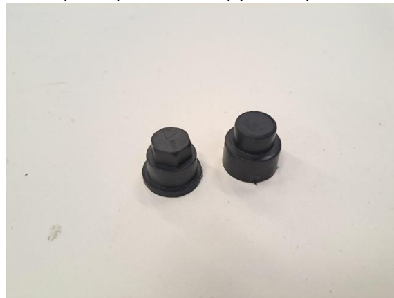
Ota tarvikkepusista etuakselin päihin tulevat tulpat.