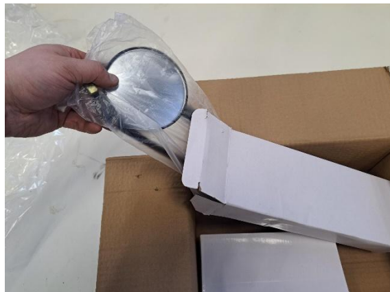
Ota sivupeilit esille.