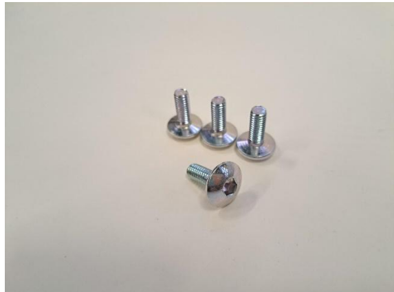
Ota tarvikepussista 4kpl kupukantaista pulttia.