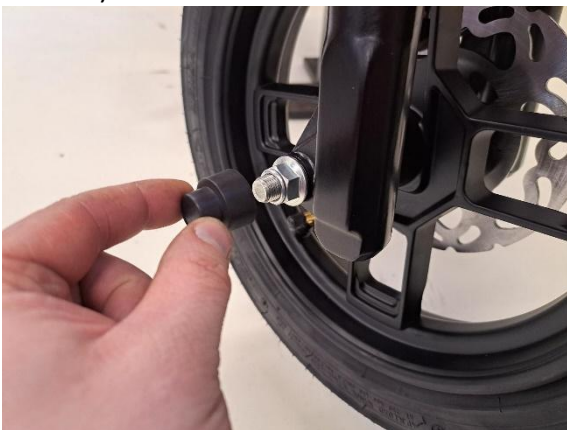
Laita tulpat paikoilleen.