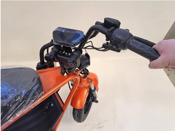
Nosta ohjaustangon puolikkaat ylös.