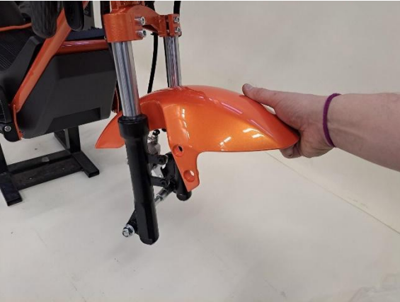
Laita etulokasuoja paikoilleen.