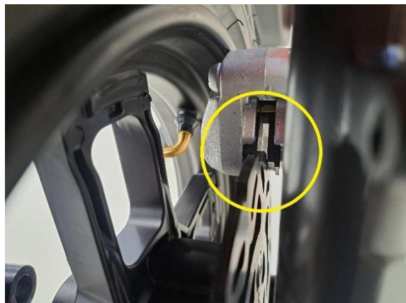
Katso, että jarrulevy asettuu etujarrupalojen väliin.