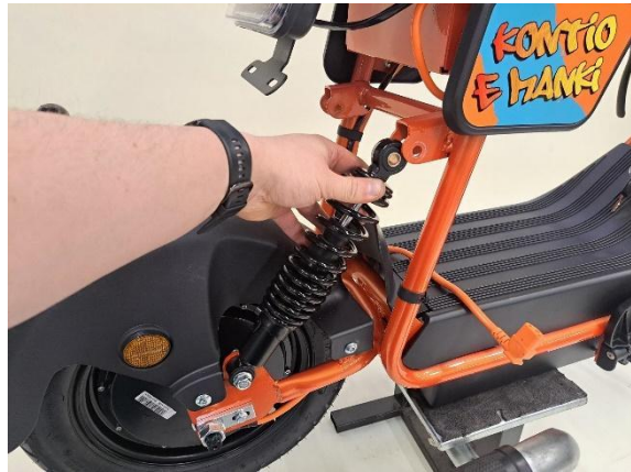
Laita takajousien yläpäätkä paikoilleen.