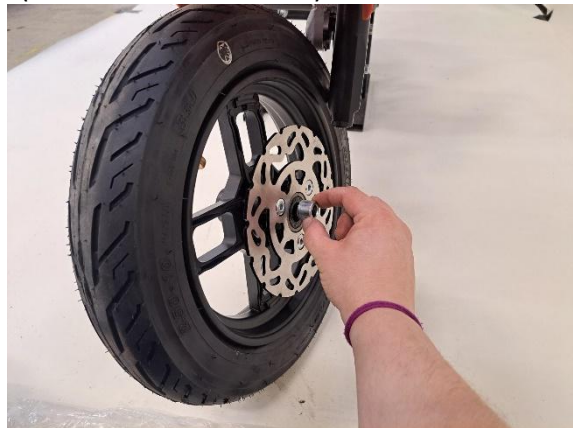
Laita lyhyempi holkki etupyörään jarrulevyn puolelle.