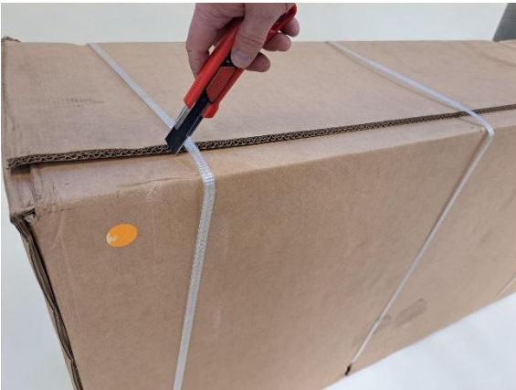
Leikkaa pakkauksen pannat poikki (katkokärkiveitsi).