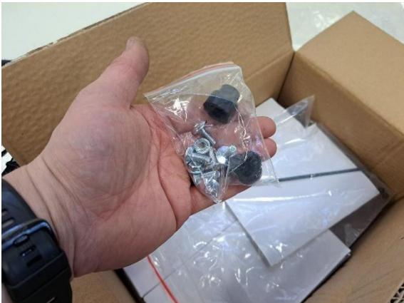
Ota tarvikepussi esille.