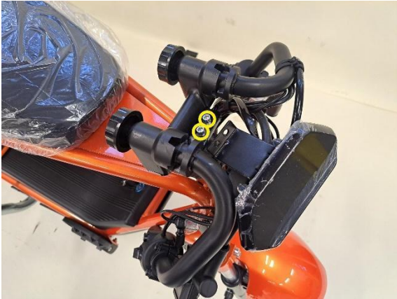
Irroita mittariston kiinnityspultit (kuusiokoloavain 5mm).